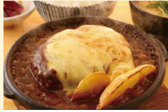
特製カレーソースの チーズハンバーグ定食