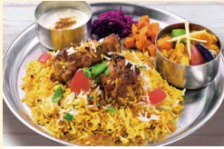
本格チキンビリヤニプレート