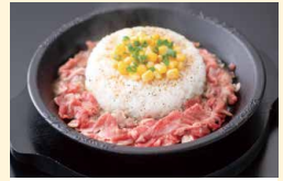
お肉たっぷり ベッパライスL