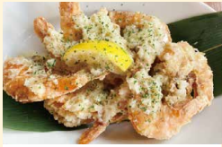
ハワイアン ガーリックシュリンプ