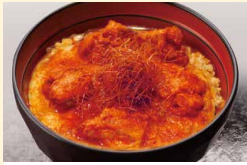
ビリ辛唐揚げ親子丼