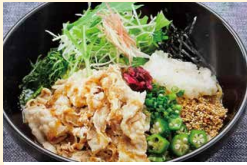
豚しゃぶとたっぷり香味野菜 の冷製和風おろし