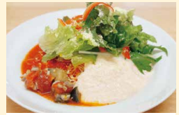
生たらの クリーミートマト冷麺