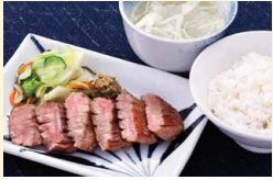
極上厚切り たん焼き定食(1人前)