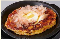
もちチーズinとん玉