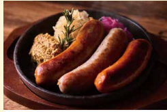
オリジナルソーセージ 3種盛り