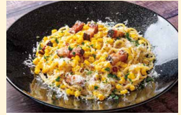
美珠産 とうもろこしのスパゲッティ