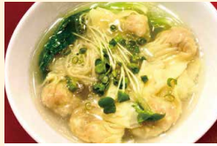
香港風清湯雲吞麵 (雲吞は海老、豚肉、野菜肉、牛肉から選択)