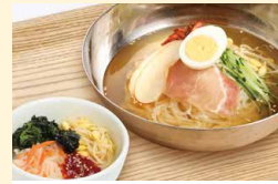
冷麺ミニピンバセット

対象メニューをご飲食いただくと投票カードをお渡しします。 あなたが「押し」と思う逸品にぜひ投票してください!