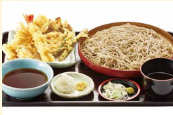
オールスター 天ぷらそば・うどん