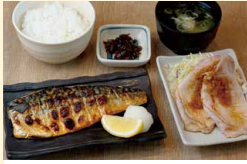
サバ・ぶた定食 (鯖の塩焼・豚の生姜焼・ご飯・みそ汁・漬物)