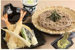
大海老天ざるそば (おろしわさび付)