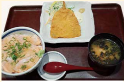
炙りサーモン塩だれ丼と 近海アジフライ