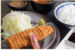
牛上ロースカツ膳(並)