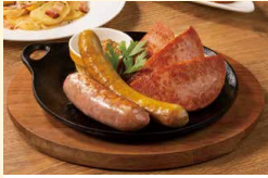
職人の“お好きな” ソーセージ盛り合わせ3種