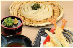
天ざるうどん・そば