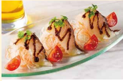
真鯛のカルパッチョ 昆布ソース