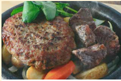
国産牛粗挽きハンバーグ& AUS産切り落としヒレステーキ