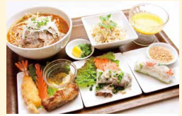
もっとお得なEセット (牛すじカレー・スープ・サラダ・デザート・ドリンク付き)